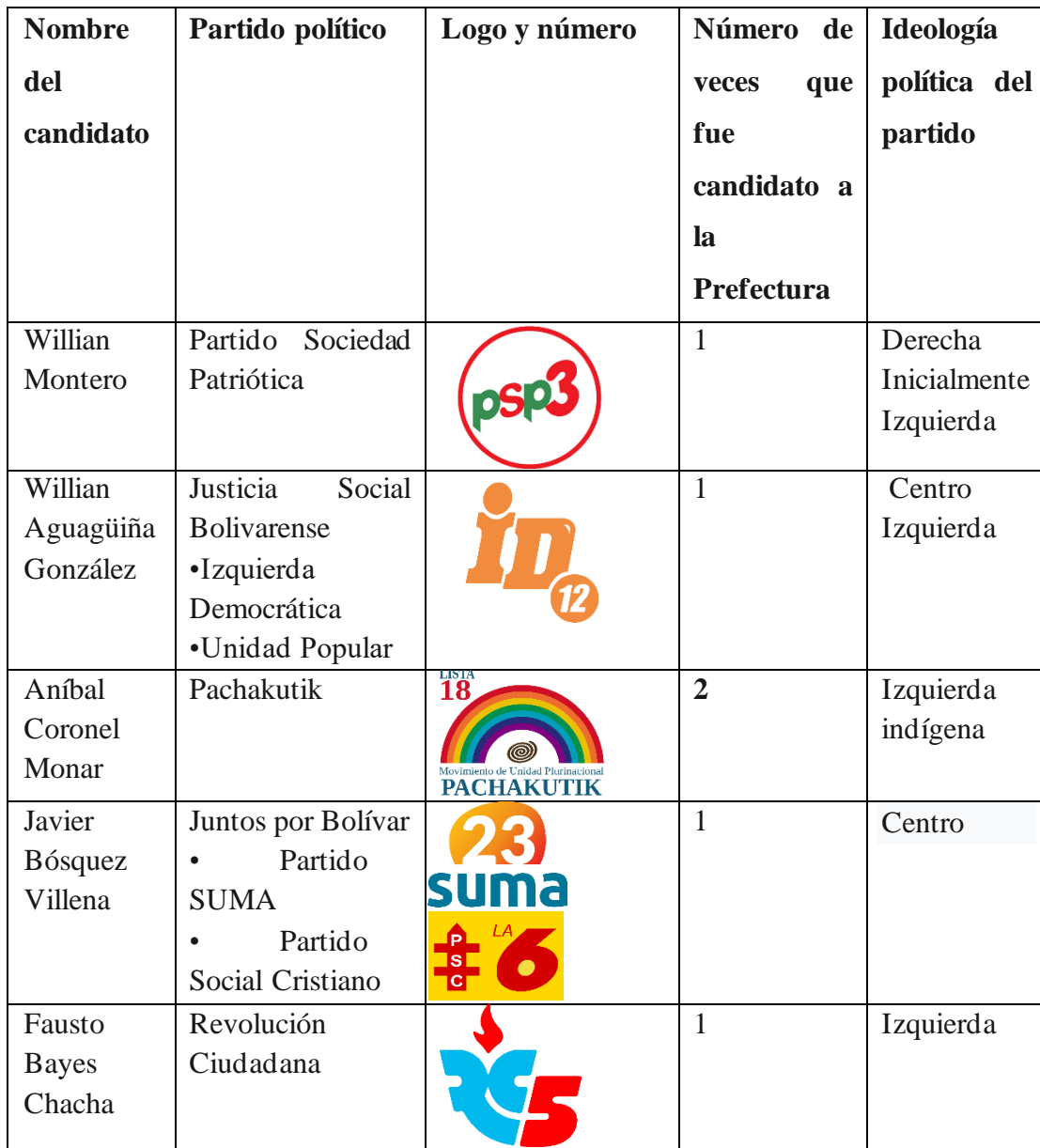
Tabla informativa de los ocho candidatos a la prefectura de Bolívar