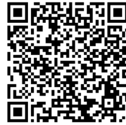
Cerro Uya Linki

ANEXO Imagen Registro de asistencia de entrevistas a los actores locales de la zona alta de Simiátug.