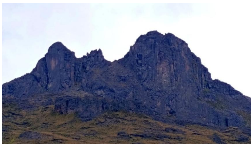
Fotografía: Meliza Masabanda