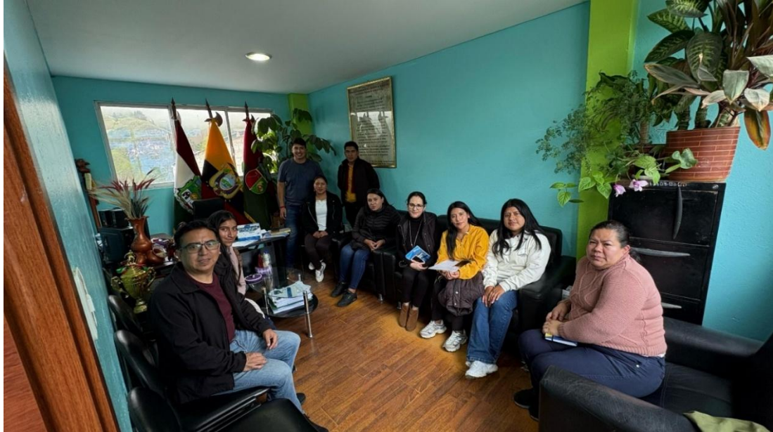
1 Figura 1: Aplicación de la entrevista a los actores a los actores claves de la comunidad de Simiátug