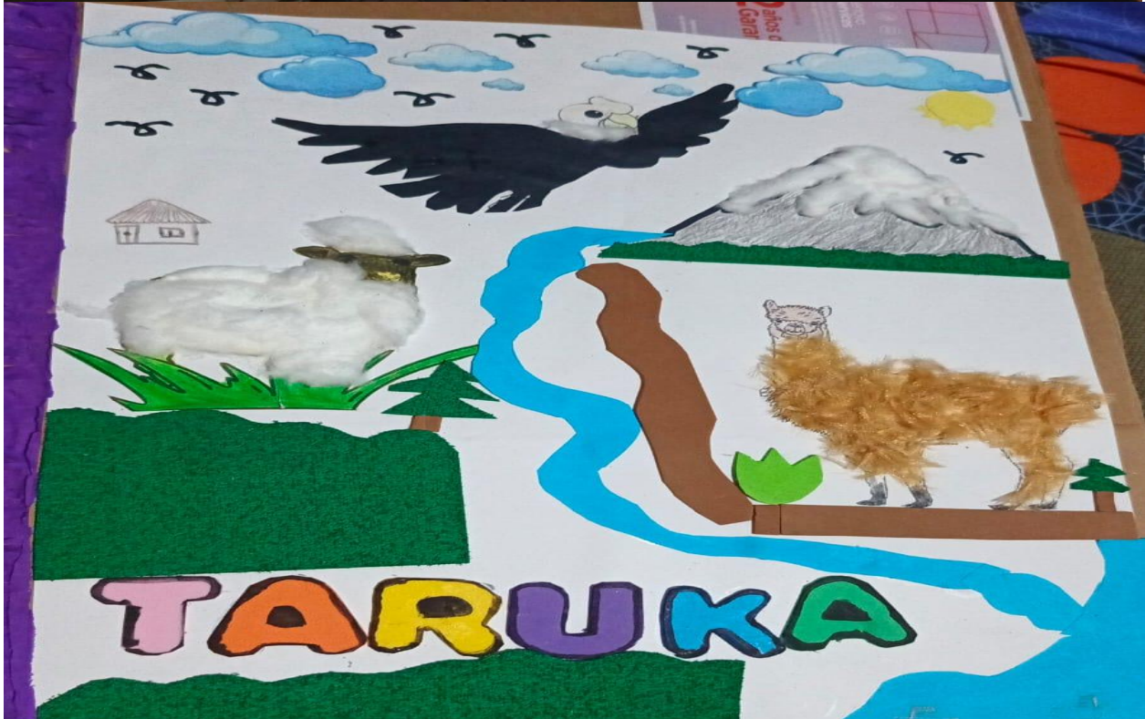
Imagen Visual 4,5