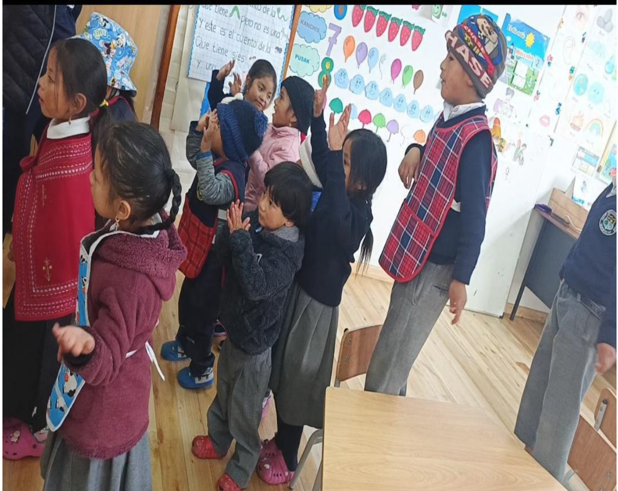
Imagen visual 3

Interpretación con una canción del cuento para la creatividad y el desarrollo cognitivo de los niños y niñas.