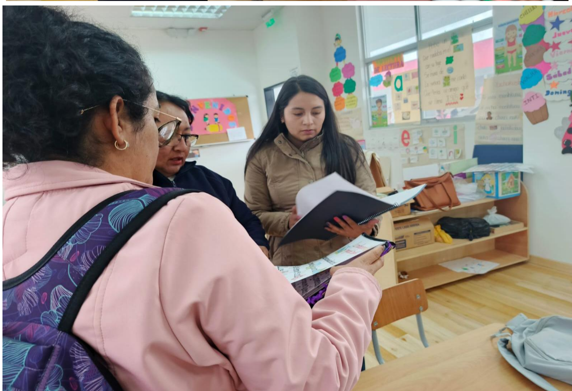
Imagen Visual 6,7,8,9