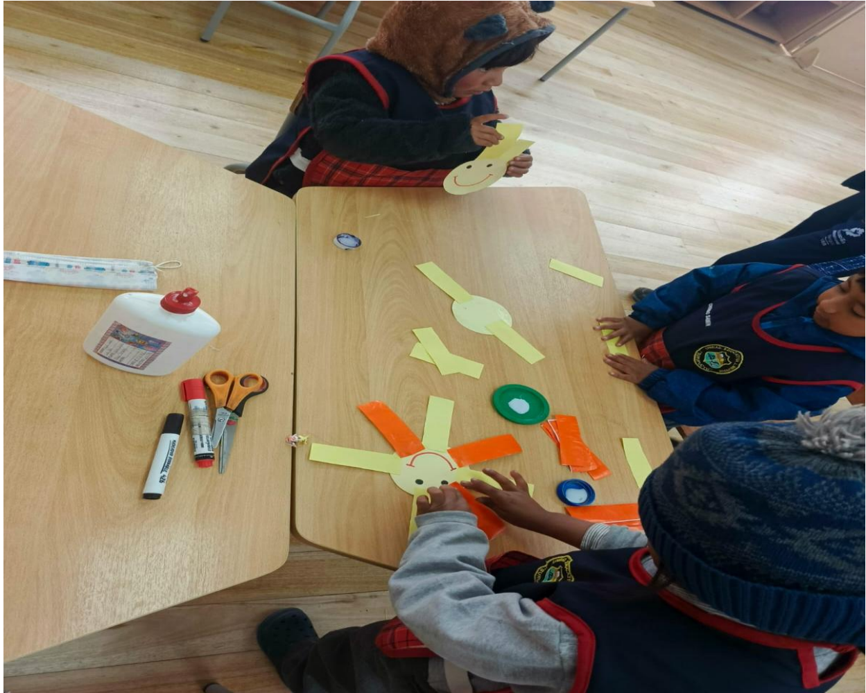
Imagen visual 1