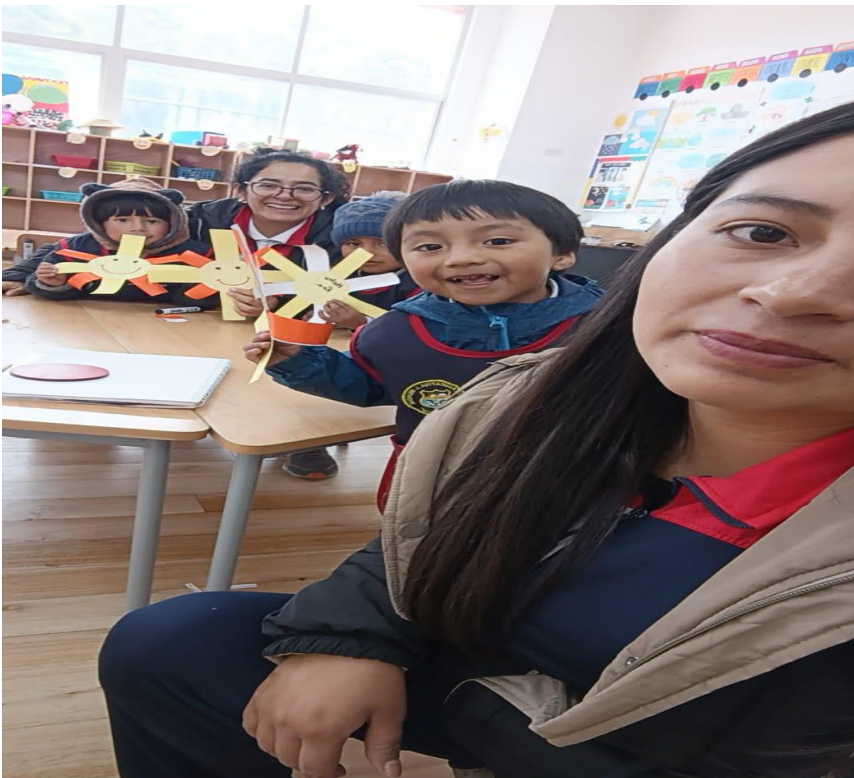
Imagen visual 2