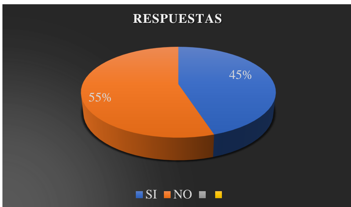
Gráfico 6: espacio físico