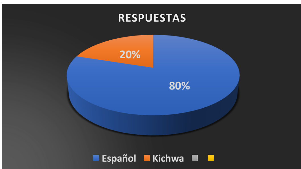
Gráfico 1: espacio físico

Elaborado por: Oscar Edison Manobanda Chimbo