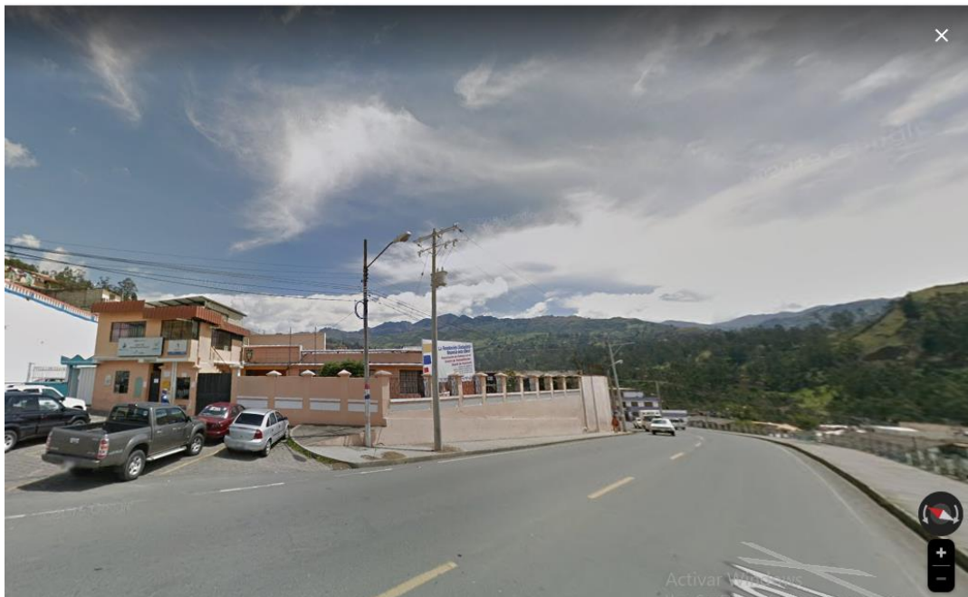
Gráfico 2 Localización Geográfica

Esta investigación se llevará a cabo en el “Centro de Rehabilitación Social del Cantón Guaranda” donde sus calles son las siguientes: Vía Guaranda Ambato entre Gustavo Lemos y 23 de abril.