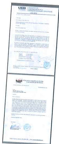
REGLAMENTO DE LA FUNDACIÓN DE DESARROLLO INTEGRAL Y AMPARO SOCIAL "SAN MIGUEL"