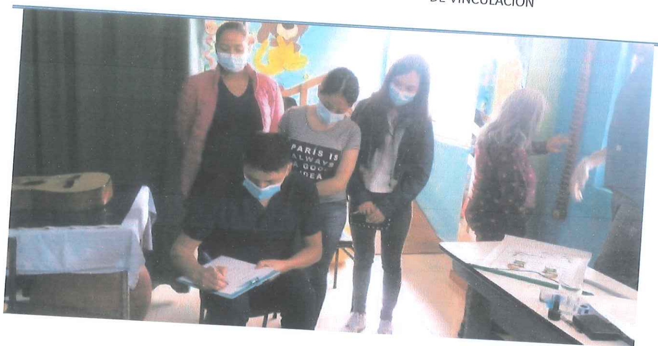
Anexo oficio de entrega y recepción del reglamento final a la FUNDACIÓN DE DESARROLLO INTEGRAL Y AMPARO SOCIAL "SAN MIGUEL"