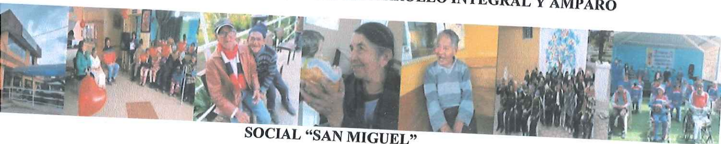
SOCIAL "SAN MIGUEL"

El objetivo de este reglamento será regular el funcionamiento del Centro del Adulto Mayor en aras a un buen gobierno, una salvaguarda de la transparencia, una correcta gestión de recursos, el respeto de derechos y deberes de todas aquéllas partes implicadas en la organización. De esta