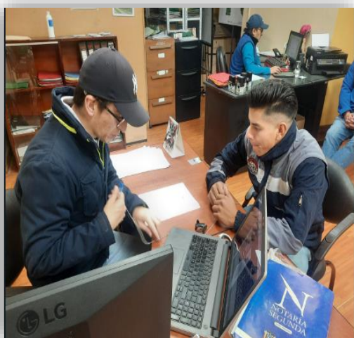
Fotografía 2: Ficha de entrevista a las autoridades de instituciones.