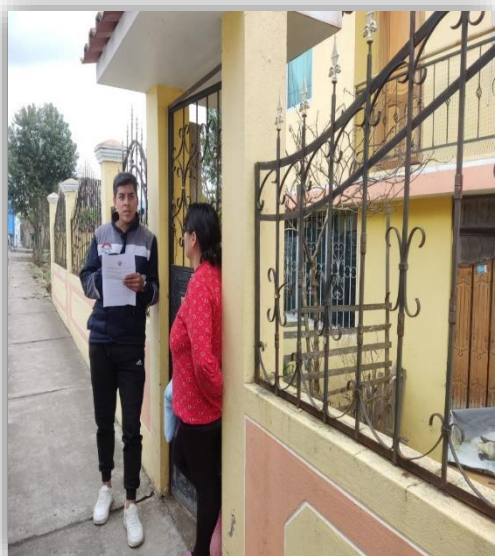
Fotografía 3: Ficha de entrevista a la ciudadanía.