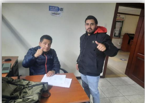
Fotografía 1: Revisión de las preguntas de la entrevista con el tutor.