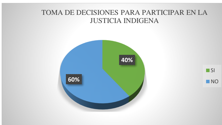
Gráfico 2. Pregunta 2