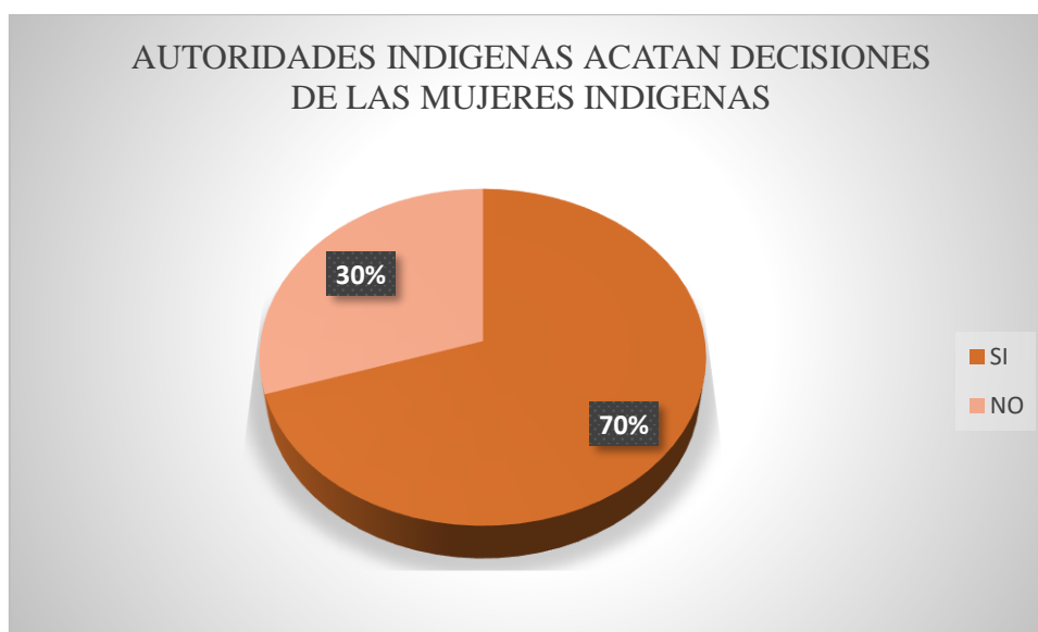
Gráfico 4. Pregunta 4