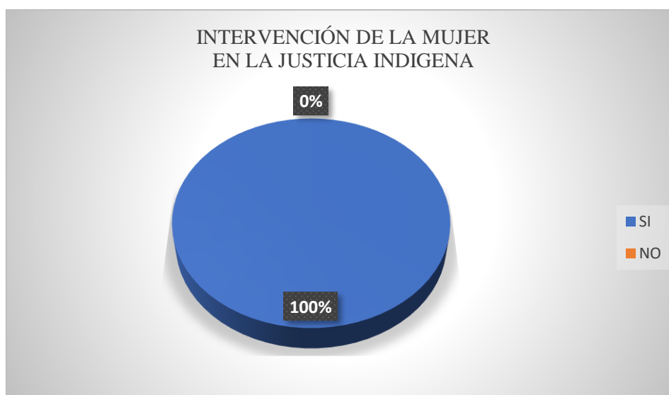
Gráfico 3. Pregunta 3