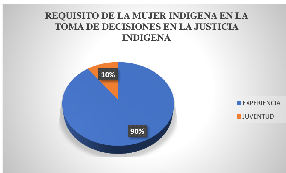
Gráfico 7. Pregunta 7

Fuente: Encuesta Autora: Vanessa Borja, 2022