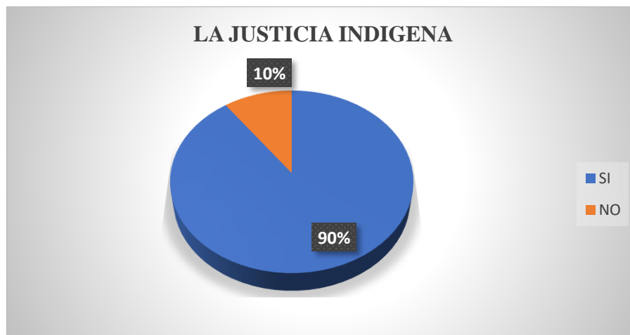
Gráfico 1. Pregunta 1