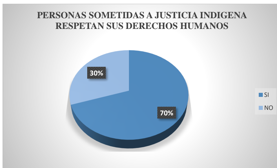
Gráfico 8. Pregunta 8