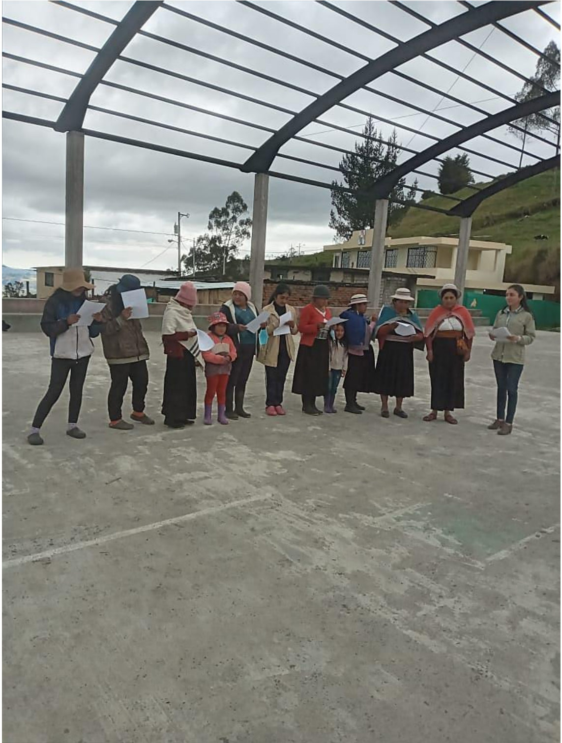
ENCUESTA DIRIGIDA A LA POBLACIÓN O MORADORES DE LA COMUNIDAD SURUPOGYOS