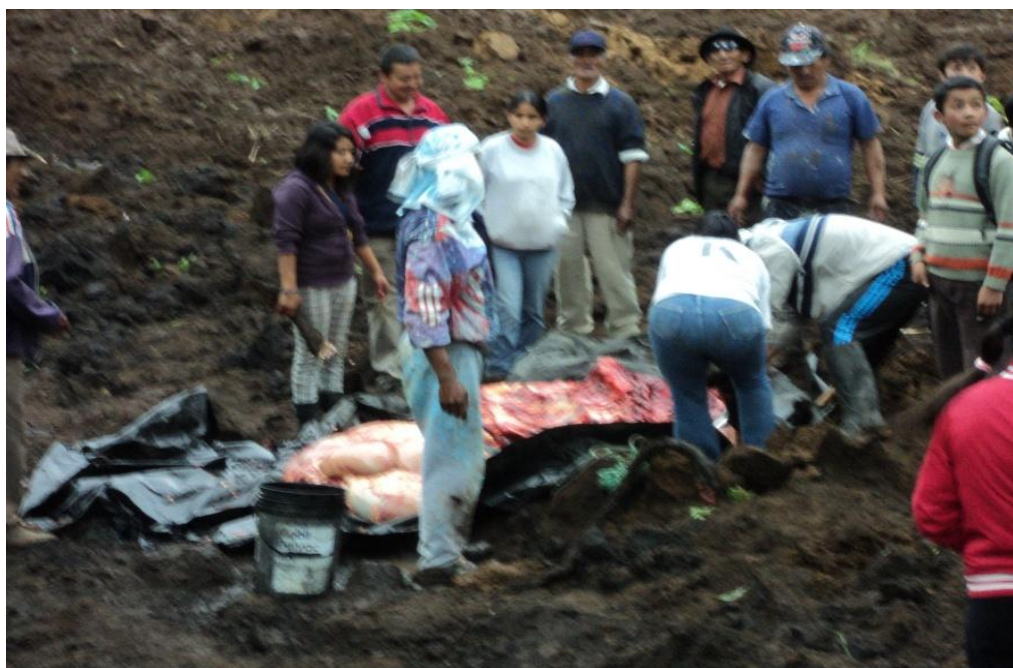
Ilustración 4. Deslizamiento de tierra barrio Tamban (Febrero del 2010). Nota: Momento que se aprovecha las cabezas de ganado aplastadas por la tierra.