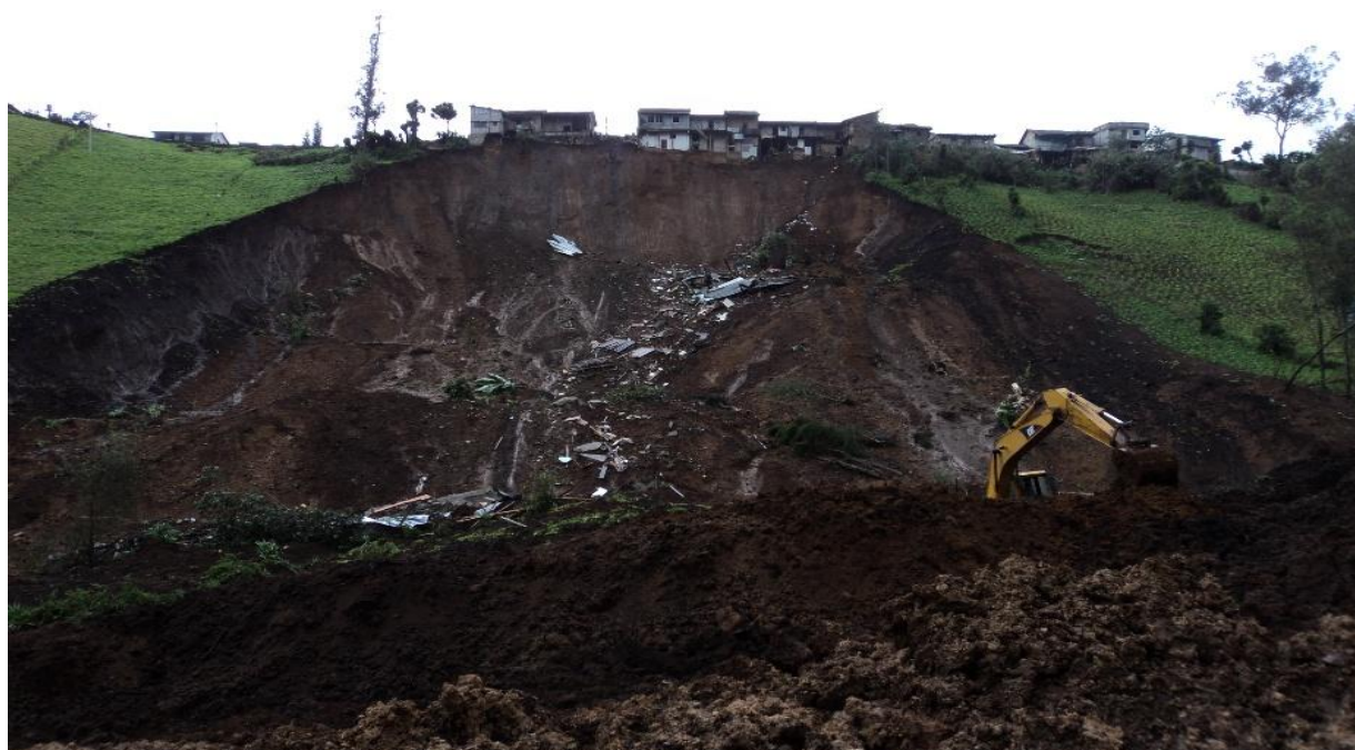
Ilustración 5. Deslizamiento de tierra barrio Tamban (Febrero del 2010). Nota: Vista frontal.