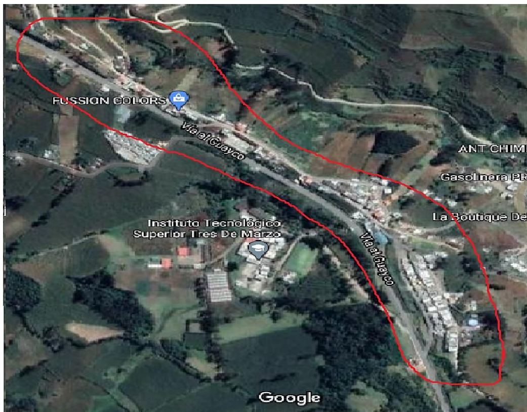
Ilustración 1. Ubicación del barrio Tamban.

El barrio Tamban perteneciente al cantón San José de Chimbo en la provincia de Bolívar,