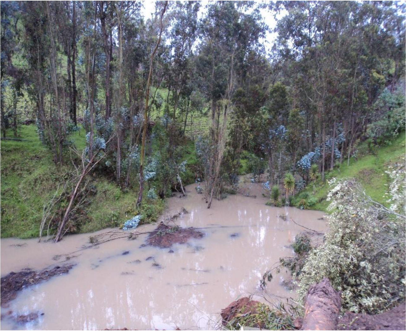
Ilustración 8. Deslizamiento de tierra barrio Tamban (Febrero del 2010).

Nota: Agua desplomada del interior de la tierra con el deslave..