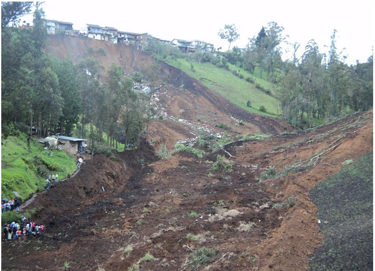
Ilustración 3. Deslizamiento de tierra barrio Tamban. (Febrero del 2010).

Adjunto imágenes del suceso capturadas por Oswaldo Montalvo, habitante del cantón Chimbo.