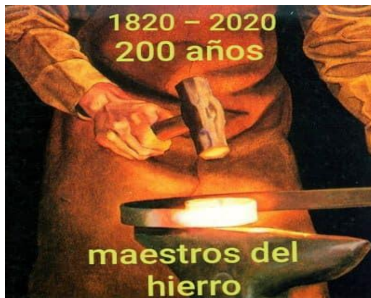
Ilustración 2. Maestros del hierro 200 años.

Es así que buscan alternativas de vida para dar continuidad a su hábil trabajo, el señor de apellido Cevallos, quien les daría los primeros pasos para la “fundición del hierro”, los hábiles artesanos de Tamban con su enorme destreza a pesar de no conocer nada de química, física ni matemática, emprende en trabajar en la aleación del hierro y su fundición, emprende en la elaboración de trapiches (maquinaria utilizada para la molienda de caña de azúcar), siendo esta la nueva artesanía y única en el centro del país, muy valorada por los hacendados de la costa y subtrópico, porque gracias a esta artesanía, fue posible la elaboración de panelas y aguardiente en los sectores de Tiandiagote, Telimbela, Balsapamba, Caluma, Echeandía y otros lugares de la provincia y el país.