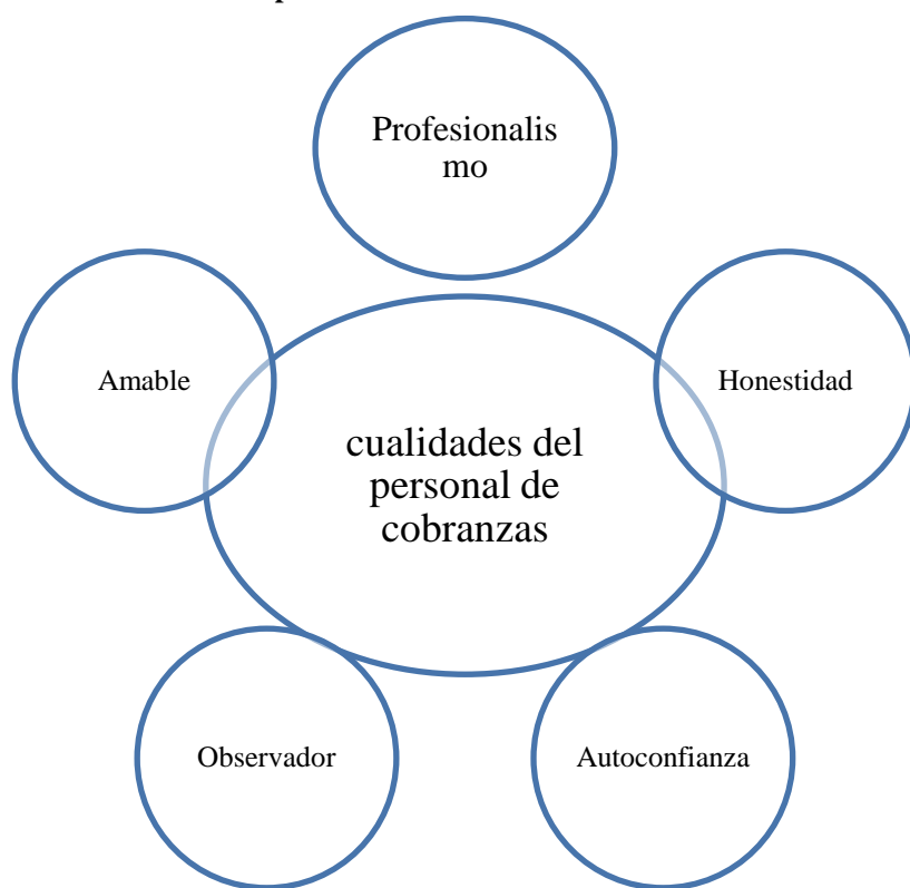
Gráfico 1. Cualidades del personal de cobranzas

Para fortalecer la ejecución de cada uno de los procesos de recaudación en el área de cobranzas sea eficiente y eficaz, el empleado debe cumplir con cualidades que le permitan brindar una mejor dialogo con el socio ya que tratan con personas de diferentes pensamientos, nivel de estudio, forma de ser y profesionales. Por lo mismo el trabajador debe desarrollar las siguientes características durante el proceso de labores en el campo de acción.