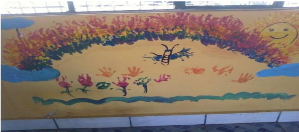
Gráfico N° 8