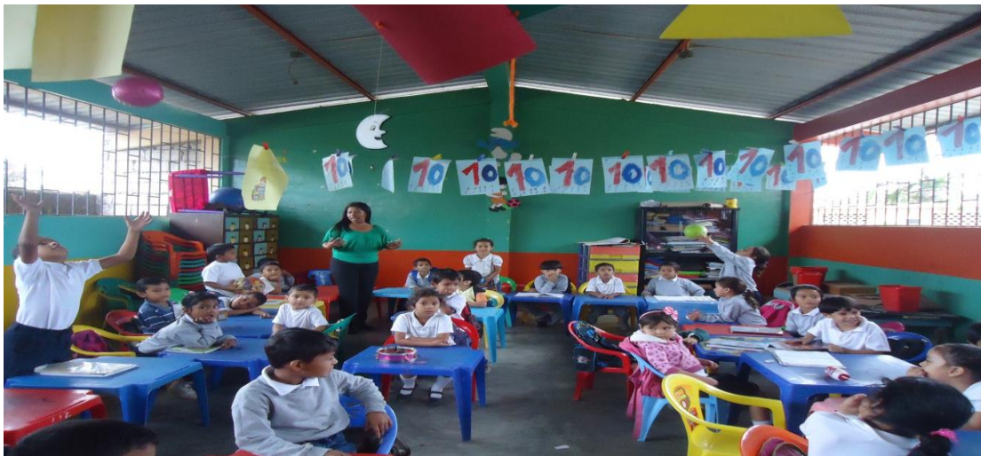
Gráfico N° 9