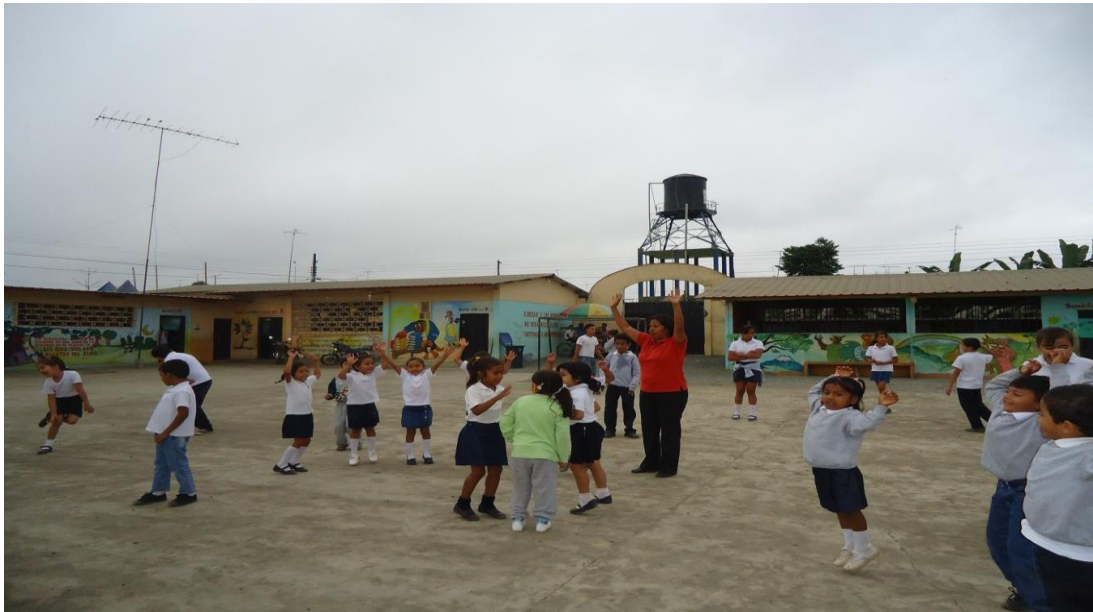
Gráfico N° 13