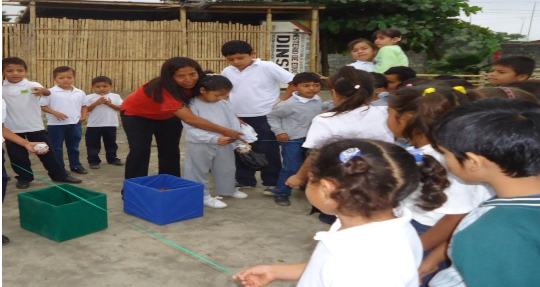
Gráfico N° 5

Fuente: Estudiantes de Primer año de la Escuela Lic. David Guevara Naranjo