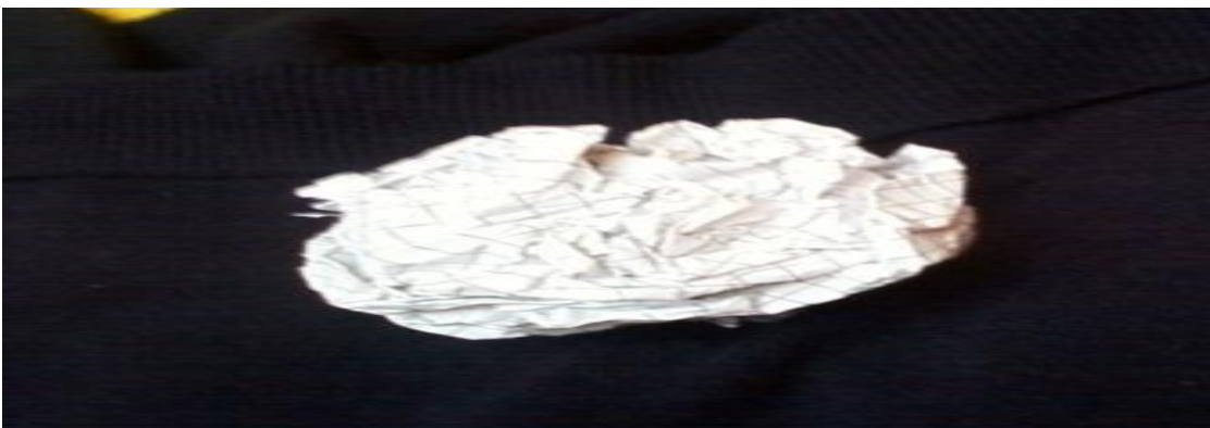
Gráfico N° 6