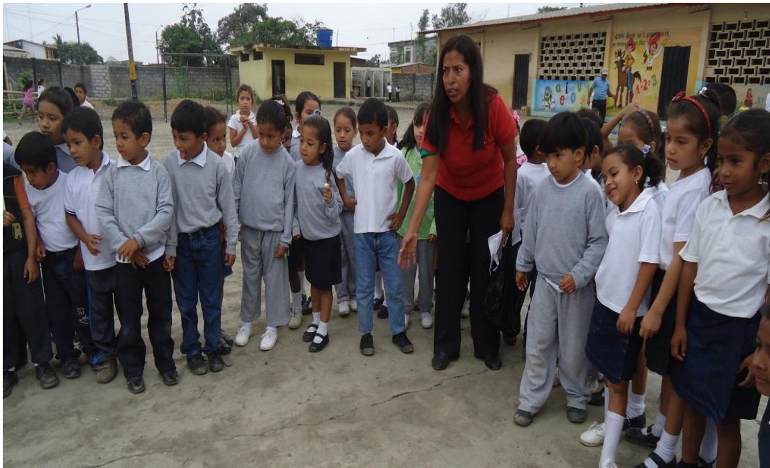
Gráfico N° 11