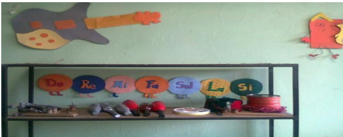
Gráfico N° 2