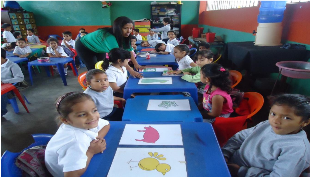
Gráfico N° 4