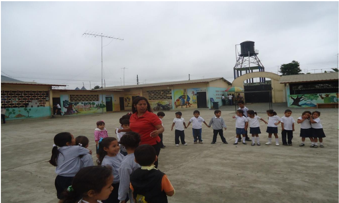
Gráfico N° 12