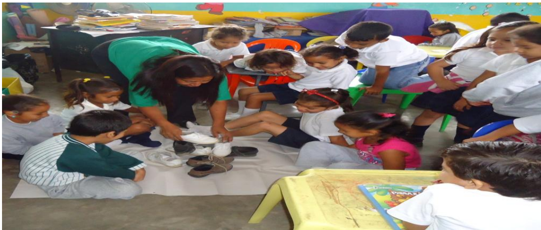
Gráfico N° 13