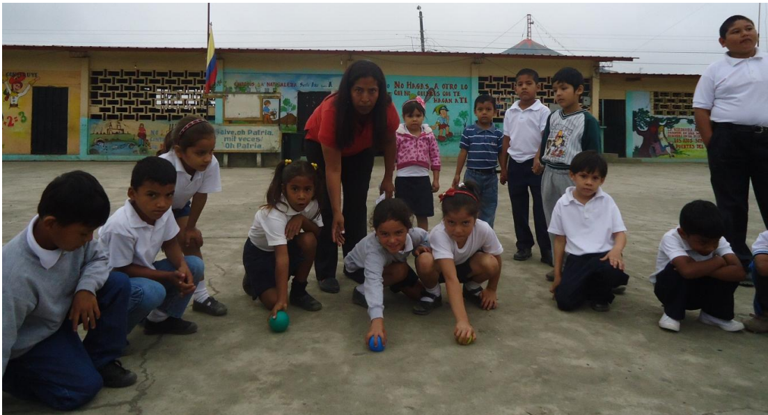
Gráfico N° 7