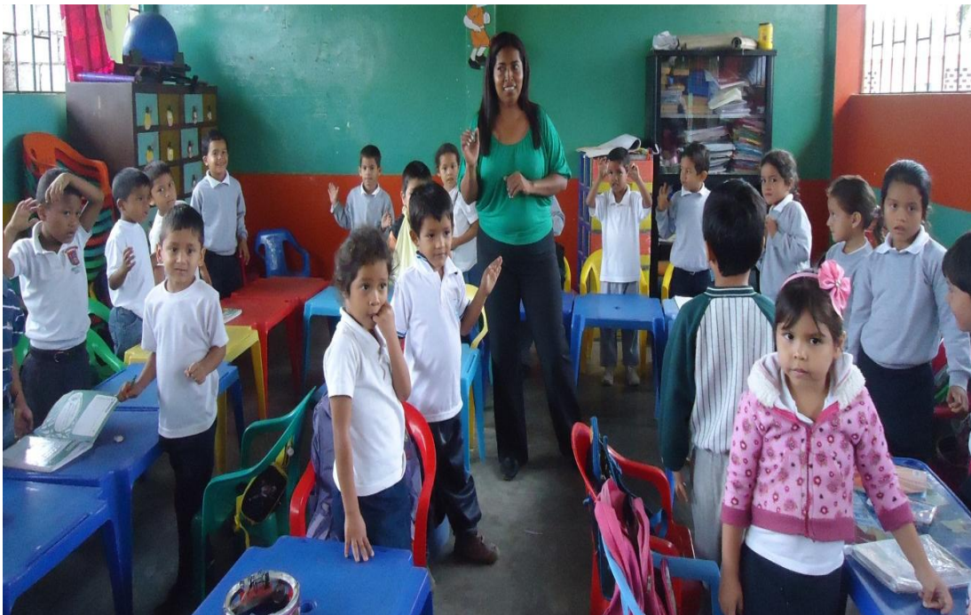
Gráfico N° 10