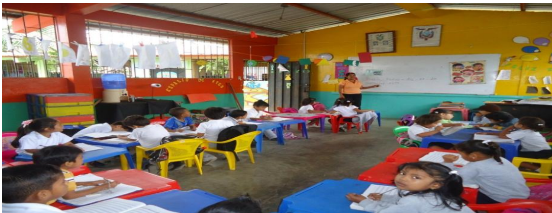
Gráfico N° 1