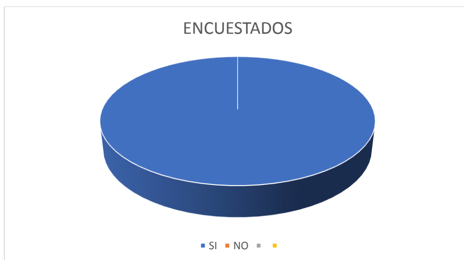
Gráfico No. 5

ANALISIS E INTERPRETAR DE RESULTADOS. – Con el ciento por ciento de las respuestas del SI, se concluye que los encuestados, tanto para los Defensores Públicos como para los Jueces de la Unidad Judicial Unidad Judicial de la Familia, Mujer, Niñez y Adolescencia del Cantón Guaranda, es importante que se llegara a normar la tenencia compartida en la legislación ecuatoriana, toda vez que ayudaría de gran manera a la aplicación y al desarrollo eficaz y eficiente del principio superior del niño, niña y adolescente a efectos del desarrollo emocional y psicológico de manera íntegro.