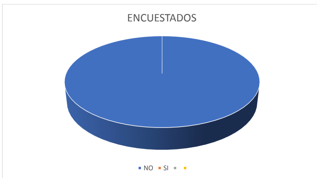
Gráfico No. 1

ANALISIS E INTERPRETAR DE RESULTADOS. – Con el cien por ciento de las respuestas del SI, manifestados por los encuestados nos da a entender que sí saben que es la tenencia compartida, pero que legalmente no existe en nuestra legislación, es decir desde el punto de vista de la realidad vivencial práctica luego de la separación de los progenitores, pero al no existir esta institución no se le ha podido legitimar y dar un respaldo legal.