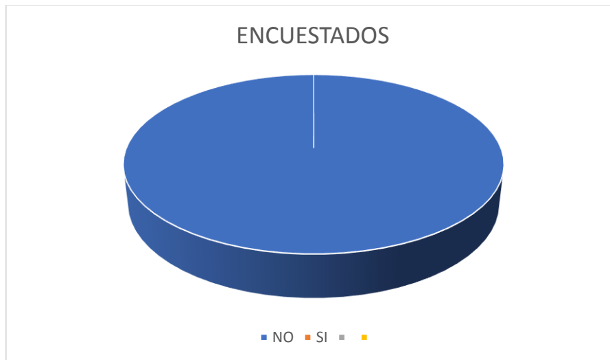
Gráfico No. 3

ANALISIS E INTERPRETAR DE RESULTADOS. – Con el cien por ciento de las respuestas del NO, manifestados por los encuestados, tanto por los Defensores Públicos como los Jueces de la Unidad Judicial Unidad Judicial de la Familia, Mujer, Niñez y Adolescencia del Cantón Guaranda, manifiestan que no conocen que exista un caso legal de la tenencia compartida, por lo que no se encuentra estipulado en nuestra legislación actual.