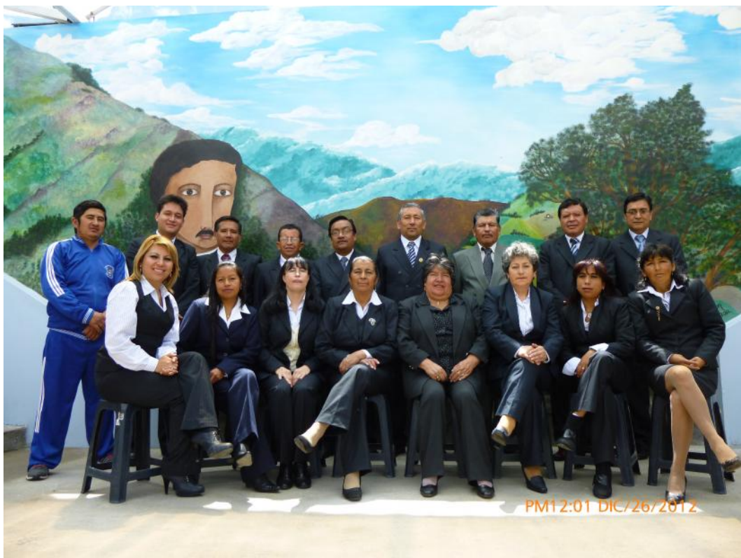
Planta docente del Colegio de Bachillerato "Eudófilo Álvarez"